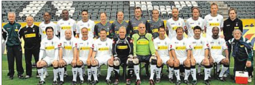
Borussia Mönchengladbach – Gemeldet wurden: Jörg Kaessmann, Peter Wynhoff, Jörg Albers, Jörg Neun, Jörg Jung, Karl-Heinz Pflipsen, Thomas Eichin, Chiquinho, Markus Möhren, Valandi Anagnostou, Oliver Neuville, Martin Schneider, Radivou Salou, Ralf Kastenmeier.